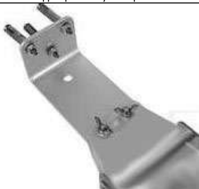
Рисунок 1: Монтажный кронштейн (настенный кронштейн) и анкерные дюбели в комплекте. Вид соединения от стены к инфракрасному обогревателю.